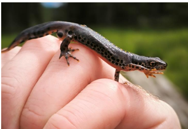
Slika 5: Planinski pupek ( Ichthyosaura alpestris ).

Odrasle in ličinke hribskega urha smo našli v lužah v gozdu Partovec (Slika 1).