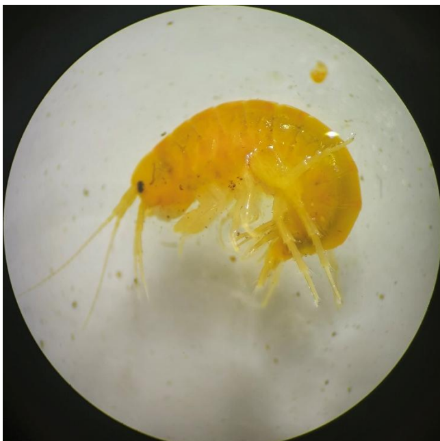
Slika 3: potočna postranica (Gammarus fossarum)