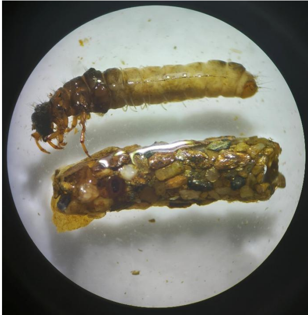
Slika 4: Ličinka mladoletnice iz družine Limnephilidae s pripadajočim tulcem. Osebek je bil zabeležen v vzorcu iz Mislinje.