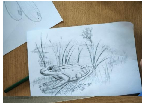
Slika 6: Ustvarjalni prikaz udeležencev tabora – ličinka kačjega pastirja iz rodu dev ( Aeshna sp.) in sekulja ( Rana temporaria ) v naravnem habitatu.