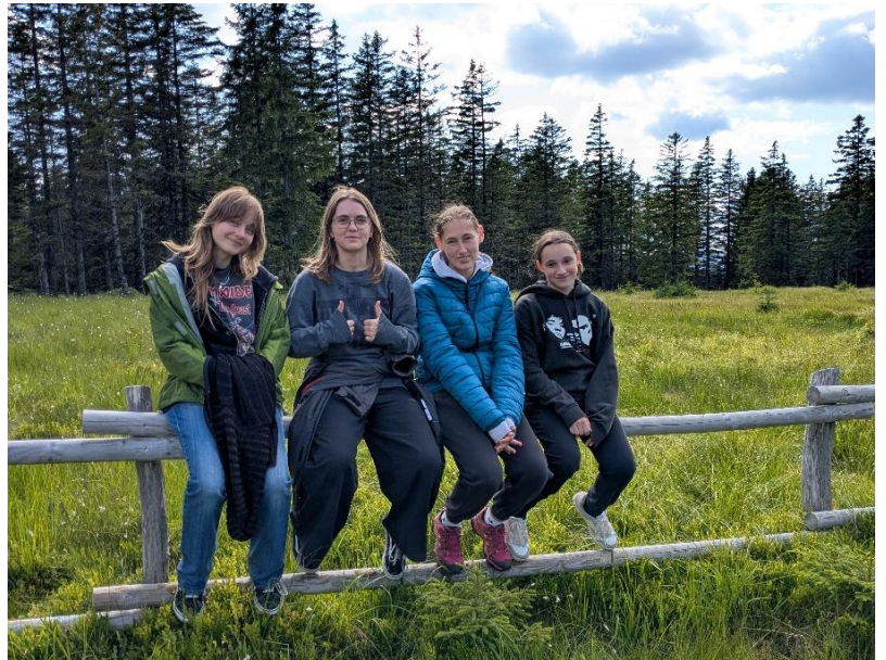
Slika 3: Botanična skupina