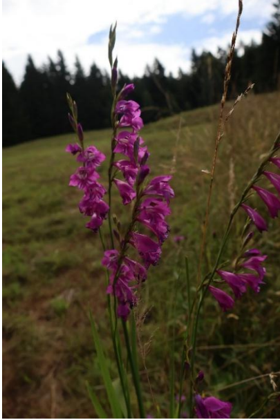
Slika 2: Ilirski meček ( Gladiolus illyricus )